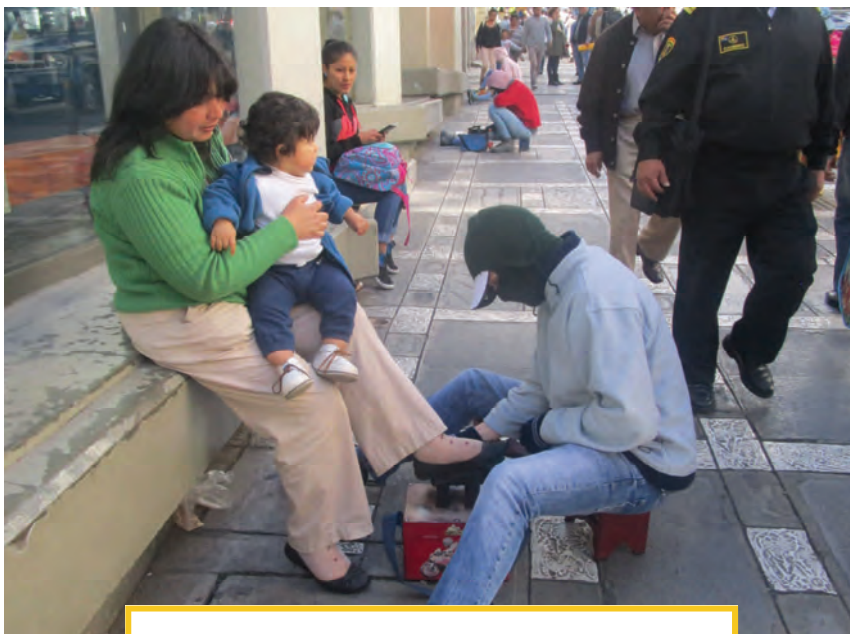
Erste Erfahrungen als Schuhputzer