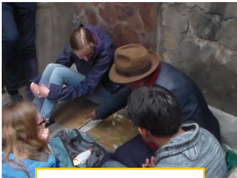
Ein Yatiri sagt mit Hilfe von Cocablättern die Zukunft voraus

ist, ist es unmöglich, aus eigener Kraft seine Lebensumstände zu verbessern, so dass man gesund lebt, an keiner existenziellen Armut leidet und seinen Kindern eine angemessene Zukunft bieten kann. Ich schenke der Arbeit von VAMOS JUNTOS höchsten Respekt, da nur Hilfe von außen in Ländern ohne Sozialstaat wie Bolivien die einzige Möglichkeit für den an Armut leidenden Großteil der Bevölkerung ist, ein menschen-