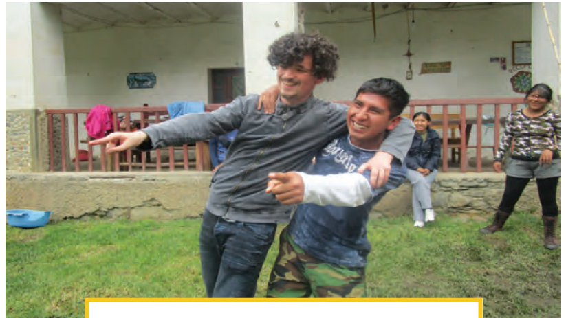
Spiele zum gegenseitigen Kennenlernen

Wichtig war es, die beiden teilnehmenden Gruppen des Austauschprojektes zusammenzubringen. Zur bolivianischen Teilnehmergruppe gehören neun Jugendliche im Alter von 17 bis 27 Jahren. Sechs der Jugendlichen sind Schuhputzer und Stipendiaten von VAMOS JUNTOS, die eine Ausbildung oder ein Studium absolvieren; drei von ihnen sind Kinder von Schuhputzern, die von VAMOS JUNTOS besonders unter-