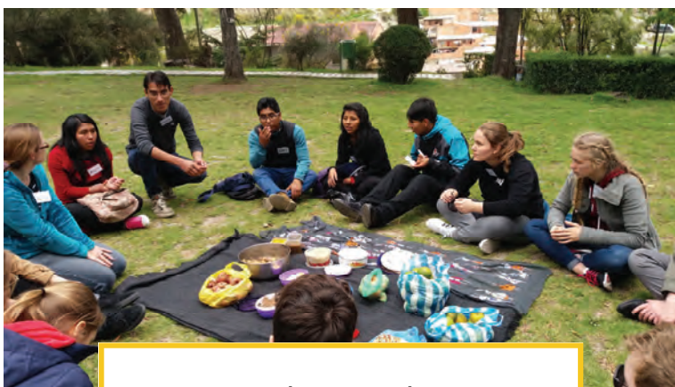
Erstes gemeinsames Mittagessen: typisch bolivianisches Aphotaphi, zu dem jeder etwas mitbringt

Um verschiedene Formen der Diskriminierung geht es auch bei unserem Jugendaustausch, den wir in diesem Jahr mit Unterstützung des Bundesministeriums für wirtschaftliche Zusammenarbeit und Entwicklung (BMZ) durchführen. Der Austausch steht unter dem Motto: „Meine Straße – Deine Straße: Diskriminierung im Alltag als globale Herausforderung“. Nach einer intensiven Vorbereitung hatten im April acht Schülerinnen und Schüler im Alter von 16 bis 20 Jahren, die in Bocholt das August-Vetter-Berufskolleg bzw. das St. Josef-Gymnasium besuchen, die Möglichkeit zu einer dreiwöchigen Begegnungsreise nach La Paz. „Es war für mich unvorstellbar, dass diese Menschen so diskriminiert werden, obwohl sie ähnliche Interessen und Wünsche ha-