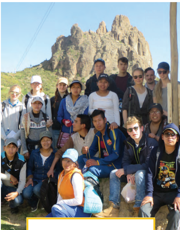
Großgruppe bei einem Ausflug

Ein gemeinsamer Ausflug direkt am Anfang sowie verschiedene Seminare förderten das Gruppengefühl. Eine große Herausforderung war dabei die Kommunikation, da auf der einen Seite die Spanischkenntnisse, auf der anderen Seite Deutsch- und Englischkenntnisse nur wenig oder gar nicht vorhanden waren. Doch genau darum ging es auch während des Austauschs: Wie geht es mir in einem fremden Land mit einer mir nicht bekannten Kultur, wo ich mich sprachlich kaum verständigen kann? In dieser Situation befinden sich zurzeit ja auch viele Flücht-