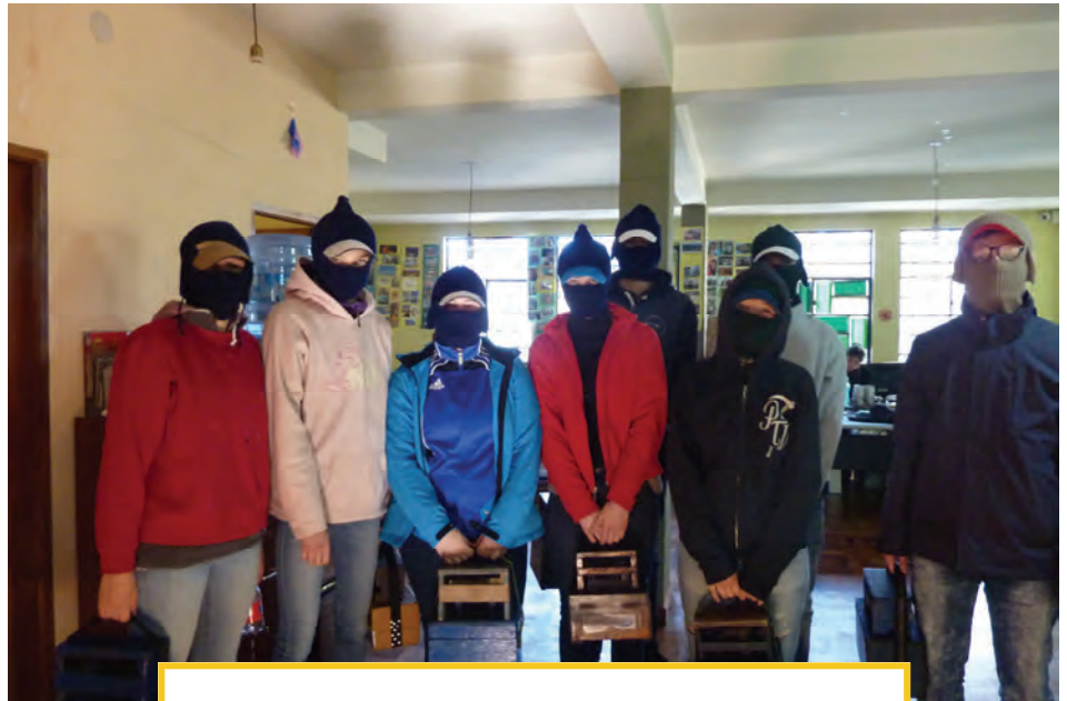
Die deutschen Teilnehmenden als Schuhputzer

Straßen zu gehen. Man merkt direkt, dass man ganz anders wahrgenommen wird, wenn man als Schuhputzer unterwegs ist. Ich hatte oft das Gefühl, die Menschen gucken an mir vorbei, als wäre ich gar nicht da, und wenn ich mal eines Blickes