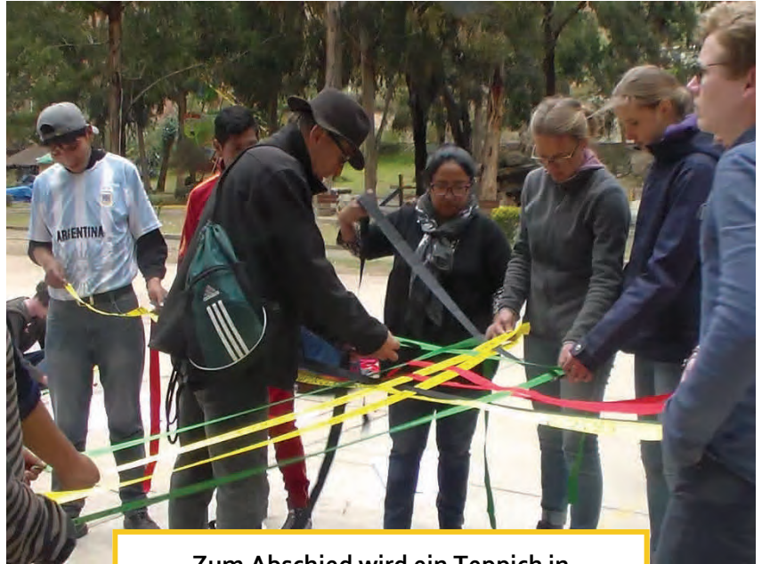
Zum Abschied wird ein Teppich in bolivianischen und deutschen Farben gewebt